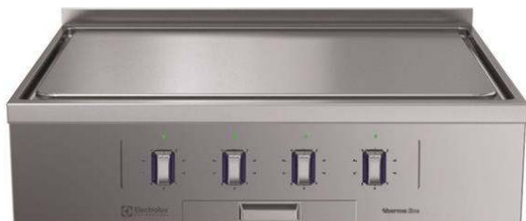
588503 (MBLDBBHOAO) Elektrisk spis med hel häll, 4 zoner, ecotop beläggning, betjänas från 1 sida